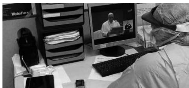
Figura 2. 26 marzo 2020, spiritualità in reparto COVID.

raggiunto il 13% di share, ponendosi al secondo posto dell'audience in quella serata superato solo dall'ultima puntata di una notissima fiction (dato inimmaginabile anche solo un mese prima). Nella figura 2, un'immagine del 26 marzo durante la preghiera in mondovisione per l'emergenza coronavirus. Nell'impossibilità per gli assistenti spirituali di raggiungere i reparti, alcuni operatori hanno "imparato" a benedire con una preghiera o con un gesto rituale i morenti,